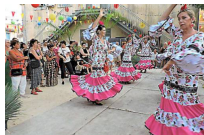
Roses rouges dans les cheveux, de bien jolies danseuses !

► Correspondante Midi Libre : 07 80 04 35 13