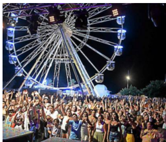
Samedi soir au Point Zéro, un dance-floor géant.