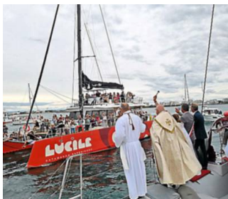
Les bateaux des plaisanciers se sont fait bénir.