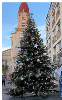
"Les Flots enchantés" auront lieu du 15 décembre au 7 janvier.

sans qui le souhaitent sous candidature et sous réserve du respect des critères de sélection. Un groupe de travail municipal a vu le jour et les préparatifs battent leur plein. Les voitures disparaîtront du parking sur le boulevard Joffre. Le cœur du village sera situé sur la promenade de la Fraternité, où 15 chalets authentiques proposeront de la gastronomie et des produits artisanaux en lien avec la magie du moment. Durant trois semaines, les entrées avec tapis rouge se situeront rue Saint-Roch et quai Paul-Cunq, les commerçants seront sollicités pour décorer et animer leurs échoppes.