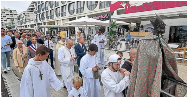
La procession a emmené saint Augustin jusqu'au front de mer pour la bénédiction des bateaux.

Ce samedi 26 et dimanche 27 août, la ville a fêté et honoré Saint-Augustin, choisi comme saint patron de la ville par « le premier curé de la ville, le père Guérin », comme un pont avec l'Algérie pour les nombreux pieds-noirs qui sont venus peupler La Grande-Motte dès sa création, ainsi que le raconte le blog de l'office de tourisme. Le samedi était festif avec des animations musicales au Point Zéro et sur la place de l'Épi. Dimanche, la messe qui devait être célébrée en plein air au parc René-Couveinhes, s'est déplacée à l'église Saint-Augustin à cause de la pluie. La procession a pu être maintenue ainsi que la bénédiction des bateaux en mer où, comme de coutume, de nombreux plaisanciers sont venus faire bénir leur embarcation.