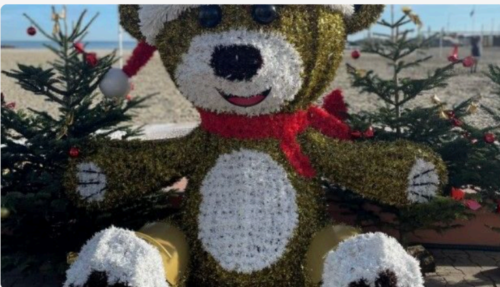
Les flots enchantés à Palavas - Ville de Palavas

Au programme : Les fêtes de Noël à Palavas, Pézenas, Aniane, Béziers et une pièce de Laurent Baffie au Kawa Théâtre de Montpellier