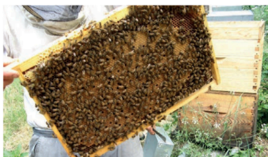
Essaim d'abeilles dans un rucher.

Prendre la D 986 vers Ganges (D986) puis, 500 m après le rond-point d'Euromédecine, tourner à gauche et suivre l'avenue des Apothicaires pendant 1,8 km jusqu'à croiser la D 127. La prendre à droite pendant 2,5 km jusqu'au centre de Grabels, puis suivre les panneaux à gauche jusqu'au parking Ponsy.