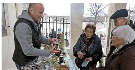
Le miel du Mudaisonnais se vend sur le marché.

► Correspondante Midi Libre : 07 04 35 13