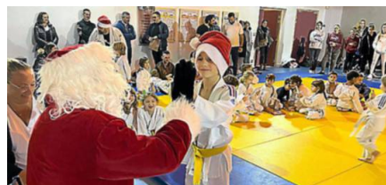
Un Père Noël est venu gâter les jeunes judokas.

Semaine triomphante pour les jeunes judokas de Lansargues. Le week-end du 16 et 17 décembre, ils ont brillé à l'occasion des districts benjamin et de la coupe départementale minime qui se sont déroulées à Meze. Sept judokas du club ont participé à ces événements et leurs efforts ont été récompensés.