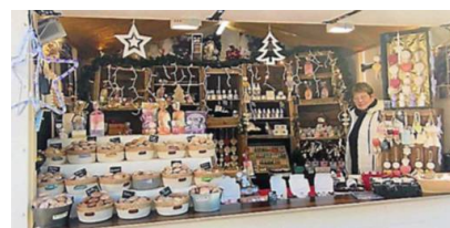
Le chalet du "Galet des volcans" est tenu par Martine Chenay.

► Correspondante Midi Libre : 07 68 37 88 08