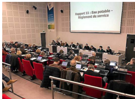
Dernière réunion de l'année pour les 46 élus du Pays de l'Or.

Depuis sa création en 2016, le conseil de développement composé de 87 bénévoles accompagne le projet de territoire "Pays de l'Or 2030". Véritable laboratoire d'idées, ils sont force de propositions pour améliorer le cadre de vie des habitants, usagers et ses 250 000 touristes lors de la période estivale. Le bilan de l'opération "mon arbre en ville", les actions de sensibilisation autour de la culture et de l'élevage camarguais auprès de 200 jeunes, le projet de résidence partagée autour d'un