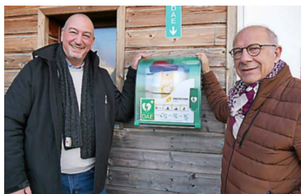
Le représentant DAE Restart en compagnie du maire de la commune.

La commune était dotée, depuis 5 ans, d'un défibrillateur situé à proximité de la mairie et de la brasserie Le Donjon (70 avenue du Val de Montferland). Depuis le 13 décembre, trois autres défibrillateurs semi-automatisés ont été installés sur différents sites. Le choix des lieux a été motivé par l'activité de proximité : au groupe scolaire Paulette Martin (ALSH La Tribu), à la Coloc' (plaine de loisirs) et au club de tennis. Il s'agit de défibrillateurs connectés et contrôlés à distance avec vérification quotidienne automatique. Ce contrôle est effectué 24 heures sur 24 grâce à une technologie de supervision embarquée et primée utilisant la transmission Sigfox indépendante. Le DAE Patriot Connect envoie tous les jours une notification (registres de maintenance) cer-