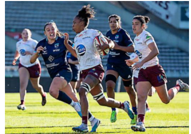
Les Héraultaises n'ont pas pu endiguer la furia bordelaise.