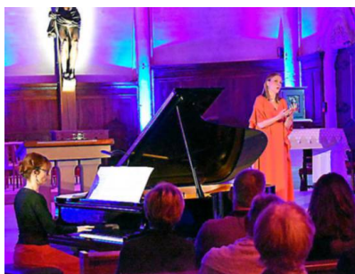
Le concert lyrique en l'église Notre-Dame-du-Lac a conquis l'auditoire.