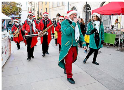
Un autre type de musique a égayé le marché avec Quality Street band.