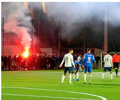
L'Atlas a encore pu compter sur ses bouillants supporters.

dès les premières minutes de la rencontre, avec un pressing haut, intense, qui prenait à la gorge les Clermontais. Pourtant, la première frappe cadrée n'intervenait qu'à la 14e minute de jeu, après un joli mouvement collectif. Les Montpelliérains tentaient par tous les moyens de déstabiliser le bloc adverse. Des transitions rapides sur les