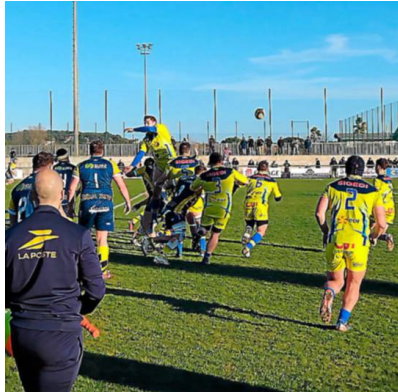
Les Agathois pourront se racheter avant la trêve. RT.

Très loin d'avoir démerité, les Agathois n'ont pas pu faire mieux contre le co-leader. Ils cèdent 28-20 face à Tricastin, une équipe jeune et athlétique qui possède une profondeur de banc plus importante que celle du ROA. C'est en partie ce qui explique leur victoire.