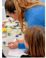
L'Office de Tourisme propose des activités manuelles pour préparer Noël.

Le programme d'animations "Mes p'tites vacances" présente une innovation bien séduisante pour cette fin d'année : des ateliers pour les parents ayant lieu au même moment que les ateliers pour leurs enfants ! Ce sera samedi 21 et dimanche 22 décembre . Pendant que les enfants découvriront la linogravure pour personnaliser des décorations de Noël, un atelier de sophro-goût permettant d'affiner sa perception des saveurs tout en renforçant son équilibre émotionnel sera proposé aux parents.