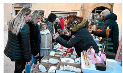
Des clients de tous âges ont été attirés par l'artisanat proposé.